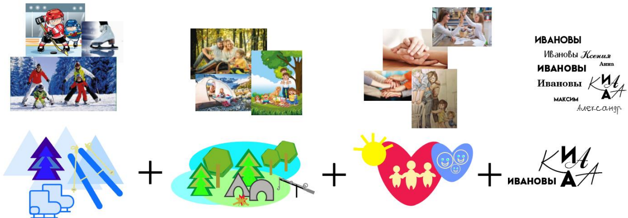
Пример концепции семейного экслибриса

Один из элементов концепции, должен включать инициалы семьи.