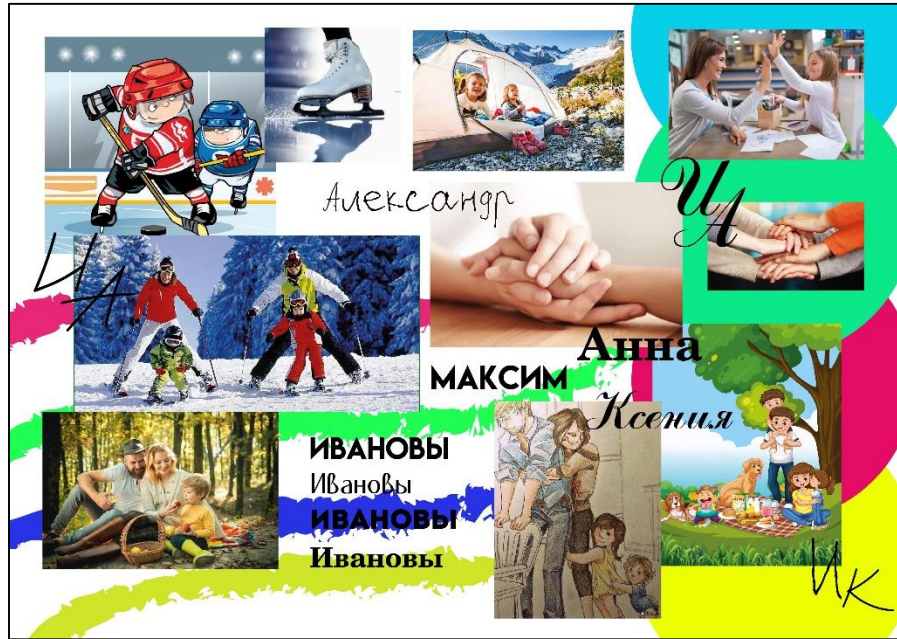
Пример выполнения задания 2