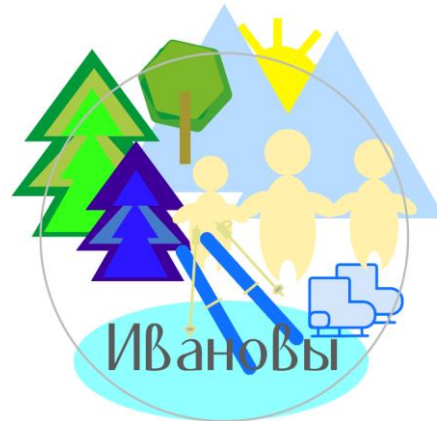
Пример итогового экслибриса